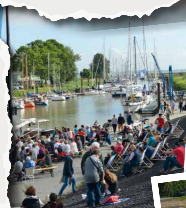
Moby Dick zu Besuch in Brunsbüttel

An Bord des bekannten Segelschiffs „Santiano“ konnten die Besucher am 17. Juni kostenlos das Stück des Ensembles „ Mär und Meer – Theater an Bord “ verfolgen. Möglich wurde das durch unsere Kooperation mit dem Stadtmarketing, der Seglervereinigung Brunsbüttel und der Seemannsmission Brunsbüttel.