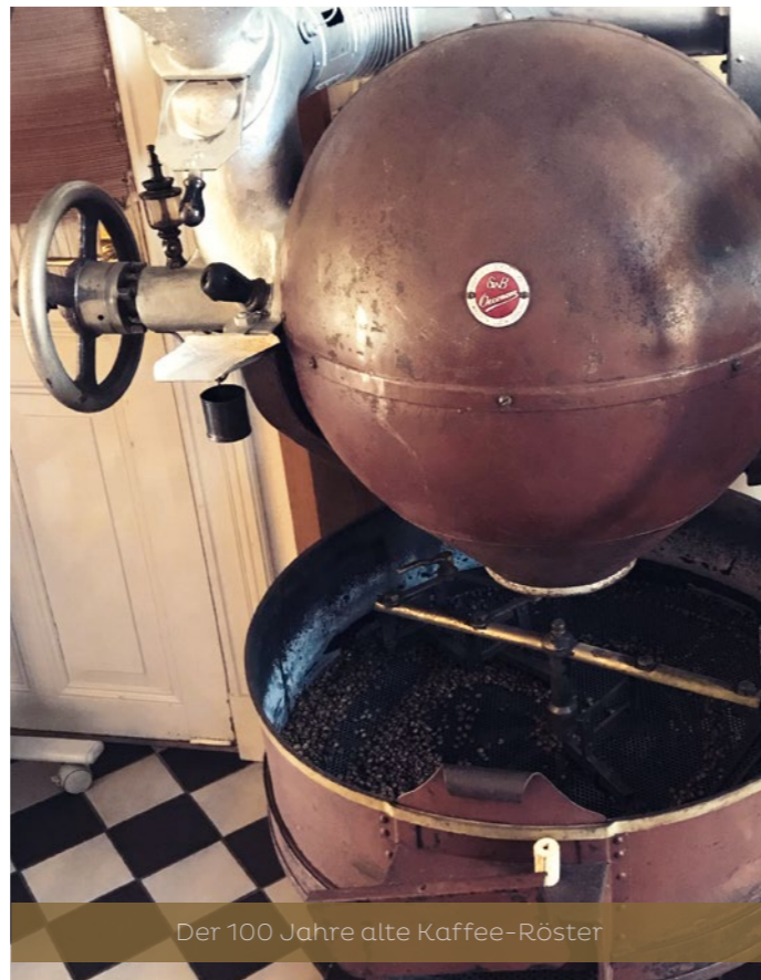
Der 100 Jahre alte Kaffee-Röster

Bei einer solchen Geschichtswerkstatt wurde Bunsen in die Dithmarscher Kaffeekultur eingeführt. Dass Eierkaffee wirklich schmeckt und nebenbei noch die Bitterstoffe aus dem Kaffee filtert, hätte er zuvor nicht für möglich gehalten. „Und dabei kam uns eine verrückte Idee“, berichtet er schmunzelnd.