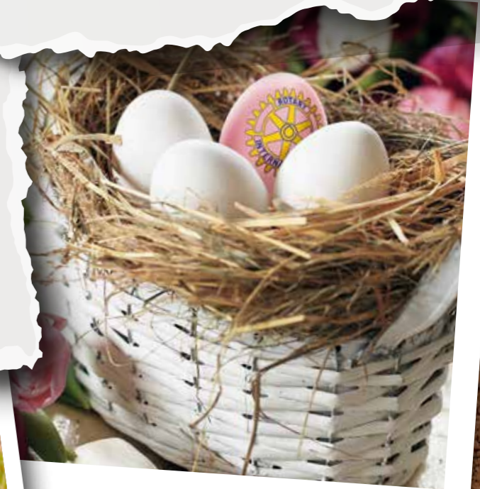
Glückseisuche mit Rotary

Gemeinsam mit dem Rotary Club stellten wir wieder die alljährliche Glückseisuche zu Ostern auf die Beine. Fünf Euro kostete ein Ei – und mit ein wenig Glück konnten die Teilnehmer tolle Preise gewinnen. Die Erlöse beliefen sich dieses Jahr auf sage und schreibe 17.500 Euro! Diese haben wir an die ehrenamtliche Jugendarbeit im Kreis weitergegeben. Die DRK Jugend, die Pfadfinder, die Jugendfeuerwehren und diverse Sportvereine freuten sich sehr über diese Unterstützung.