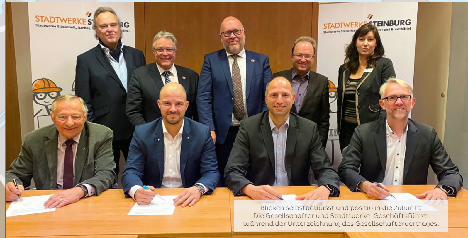
Blicken selbstbewusst und positiv in die Zukunft: Die Gesellschafter und Stadtwerke-Geschäftsführer während der Unterzeichnung des Gesellschaftervertrages.