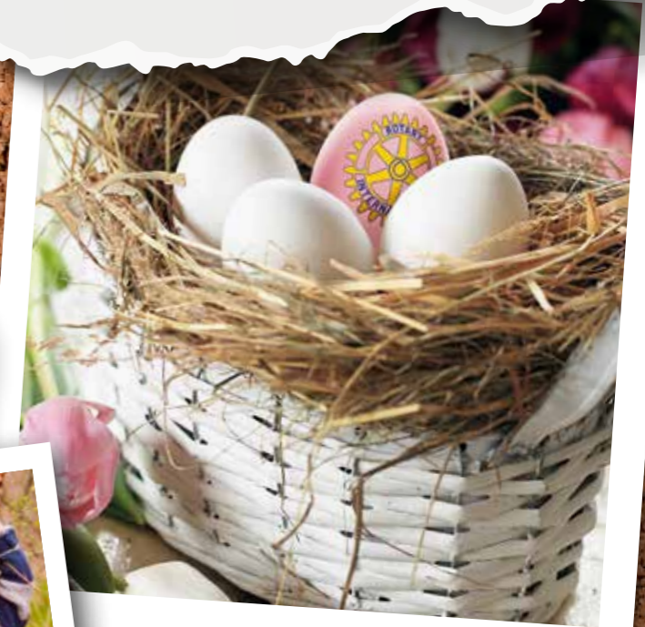
Glückseisuche mit Rotary

Am 25. März war es wieder so weit: Gemeinsam mit dem Rotary-Club starteten wir die alljährliche Glückseisuche. Für fünf Euro pro Ei gibt es wieder tolle Preise zu gewinnen, darunter ein Fahrrad, einen Strandkorb, ein iPad oder ein iPhone. Die Erlöse spenden wir dieses Jahr an die Jugendarbeit aller ehrenamtlichen Hilfsorganisationen in Dithmarschen, z. B. ans Technische Hilfswerk, ans Deutsche Rote Kreuz oder an Feuerwehren.